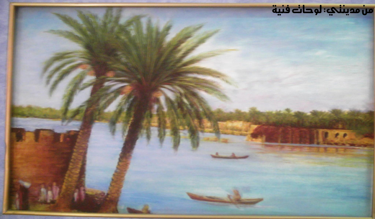
نهر الفرات في هيت