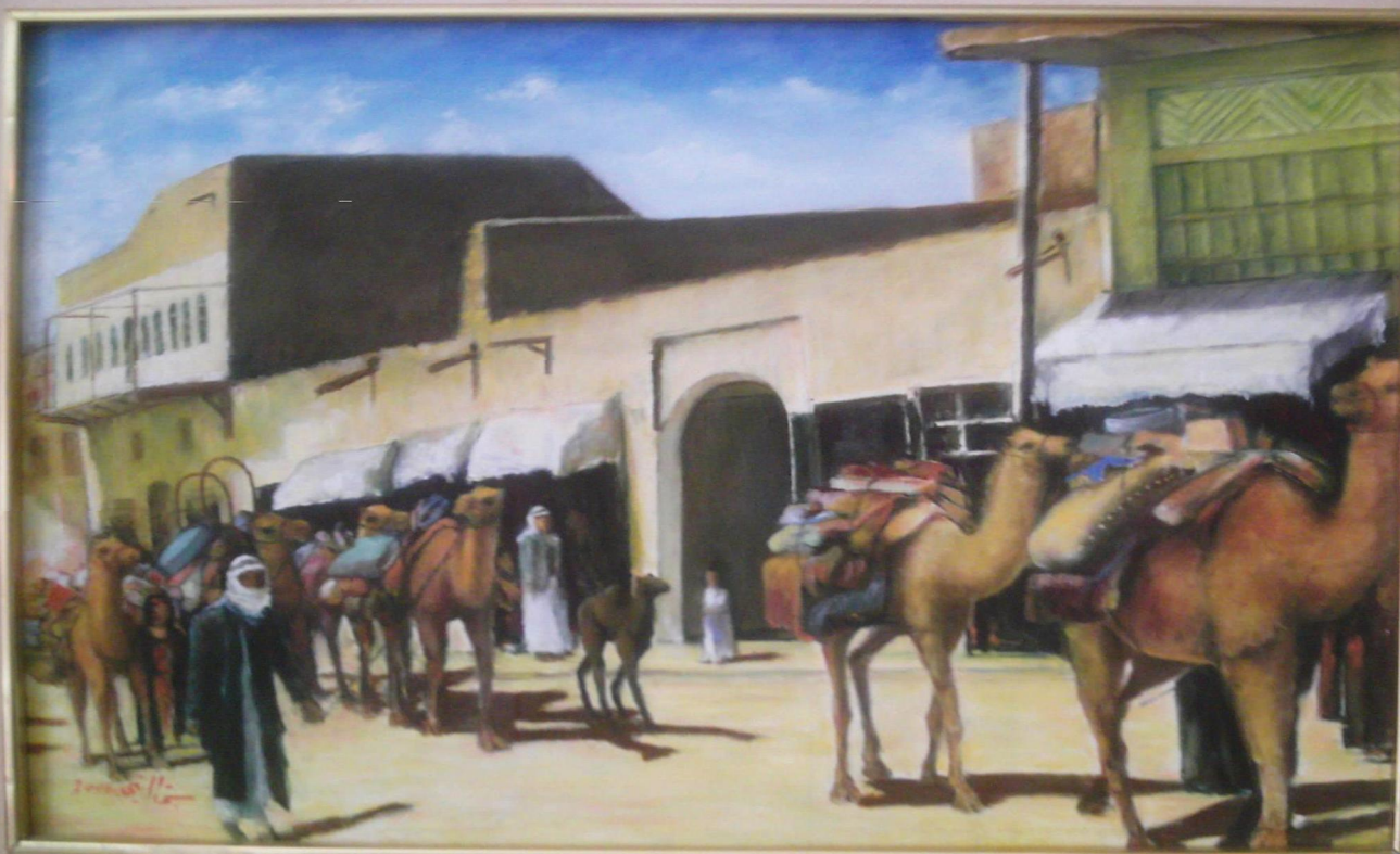
سوق هيت الرئيسي

المصادر: ١. ستي الهيتي (٢٠١٠). لوحات فنية.